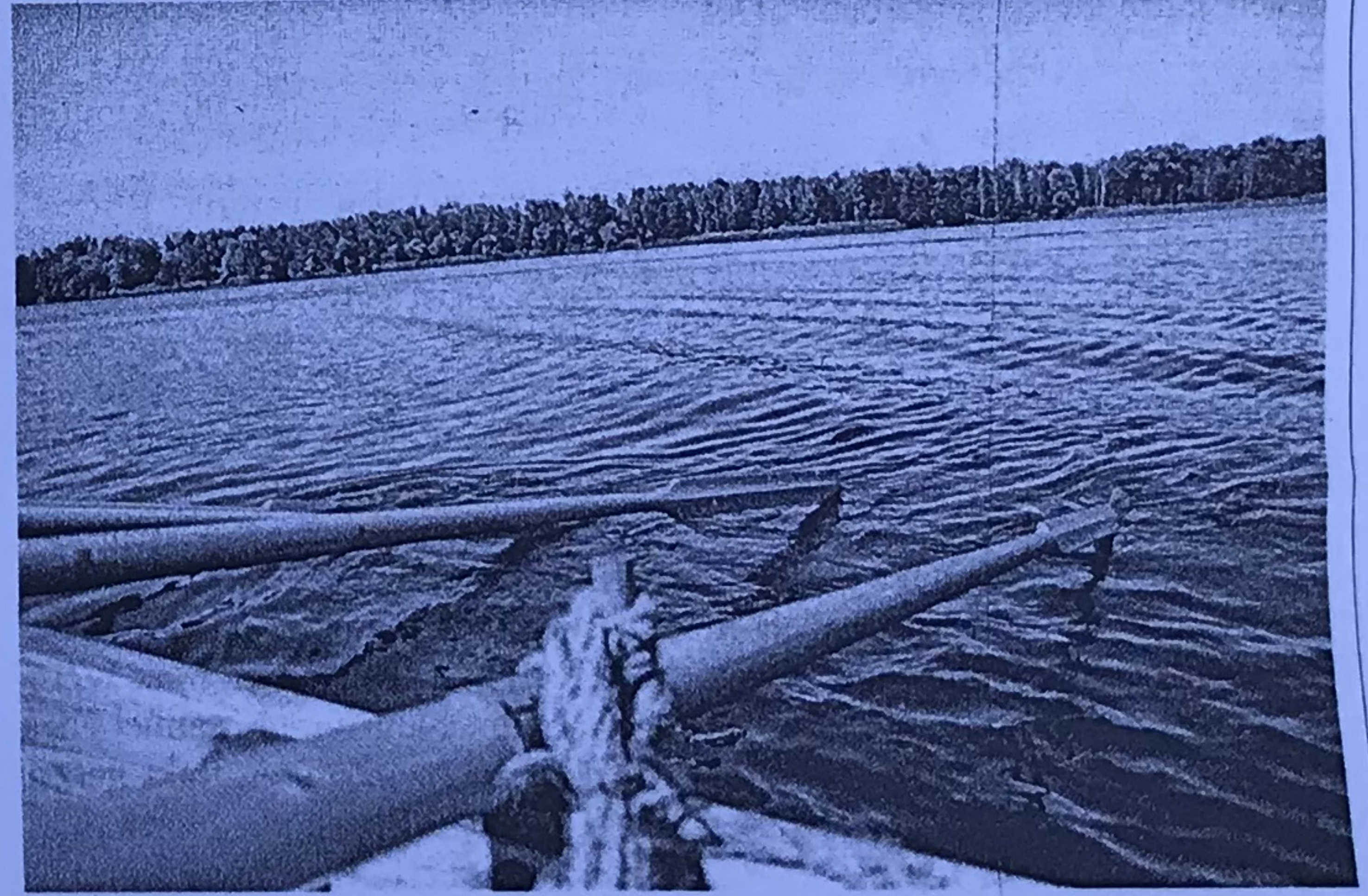
Am Donnerstag konnten Gäste des Kelten-Römer-Museums den Schiffsnachbau auf einem Manchinger Weiher „probefahren“.

Wann genau die Schiffe gebaut wurden, können die Experten nicht sagen. Aus der Analyse des Materials geht hervor, dass sie frühestens im Jahr 90 nach Christus gebaut wurden und nicht viel später als im Jahr 100. Sie sind damit etwa 1900 Jahre alt und die am besten erhaltenen Römerschiffe nördlich der Al-